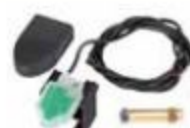
SAFEcoder encoder assoluto magnetico BUS (Brevetto FAAC)