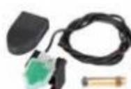
SAFEcoder encoder assoluto magnetico BUS (Brevetto FAAC) 404040