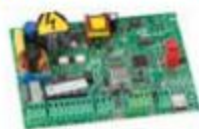
Scheda elettronica E045 Info a pag. 164 In esaurimento 790005