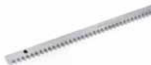
Cremagliera zincata 30x12 mod. 4 con attacchi a saldare inclusi (confez. da 4 m)

Codice articolo 404019 Prezzo (euro) 60,00