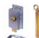
Accessori vari pagina 189