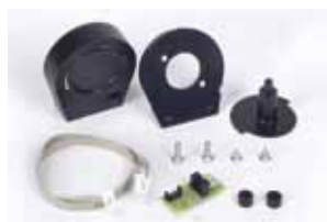
Encoder per 740 D (*) (ad esaurimento)

Codice articolo 404019 Prezzo (euro) 60,00