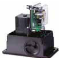
Scheda elettronica 740D (incorporata nell'automatismo)