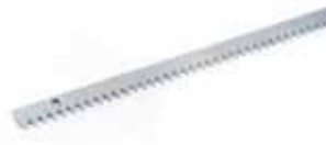
Cremagliera zincata 30x8 mod. 4 con attacchi con fissaggio meccanico inclusi (confez. da 4 m)

Codice articolo 490124 Prezzo (euro) 95,00