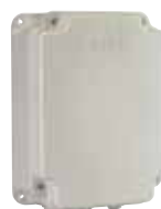
Contenitore mod. E per schede elettroniche

Codice articolo 720118 Prezzo (euro) 32,00