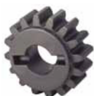
Pignone Z16 cremagliera

Codice articolo 7191661 Prezzo (euro) 42,00