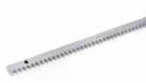
Cremagliera e catena Vedi a pagina 96

Codice articolo 71275101-36 Prezzo (euro) 17,00