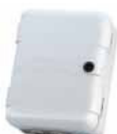
Contenitore mod. L per schede elettroniche

Codice articolo 720118 Prezzo (euro) 32,00