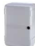
Contenitore mod. LM per schede elettroniche

Codice articolo 720119 Prezzo (euro) 21,00