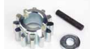
Pignone Z12 cremagliera (cancello peso max 2.200 kg)

Codice articolo 7191661 Prezzo (euro) 42,00