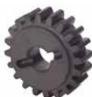
Pignone Z20 cremagliera

Codice articolo 719130 Prezzo (euro) 28,00