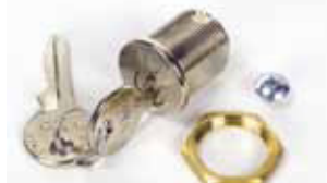
Serratura di sblocco con chiave personalizzata

Codice articolo 737816 Prezzo (euro) 30,00