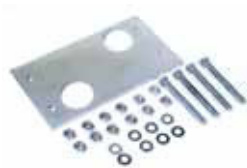
Piastra di fondazione con regolazioni laterali ed in altezza (confez. da 6 pz.)

Codice articolo 720309 Prezzo (euro) 49,00