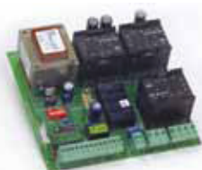
Scheda elettronica 844 T Caratt. tecniche a pagina 165

Codice articolo 790862 Prezzo (euro) 405,00