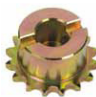
Pignone Z16 catena

Codice articolo 719167 Prezzo (euro) 28,00