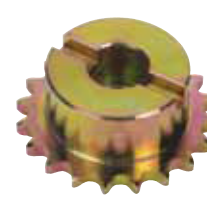
Pignone Z20 catena

Codice articolo 719137 Prezzo (euro) 42,00