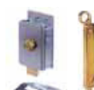
Accessori vari pagina 189