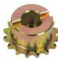
Pignone Z16 catena

Codice articolo 719167 Prezzo (euro) 28,00