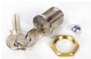
Serratura di sblocco con chiave personalizzata

Codice articolo 737816 Prezzo (euro) 30,00