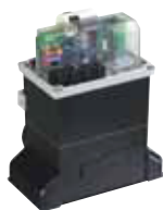
Scheda elettronica 780 D (incorporata nell'automatismo)